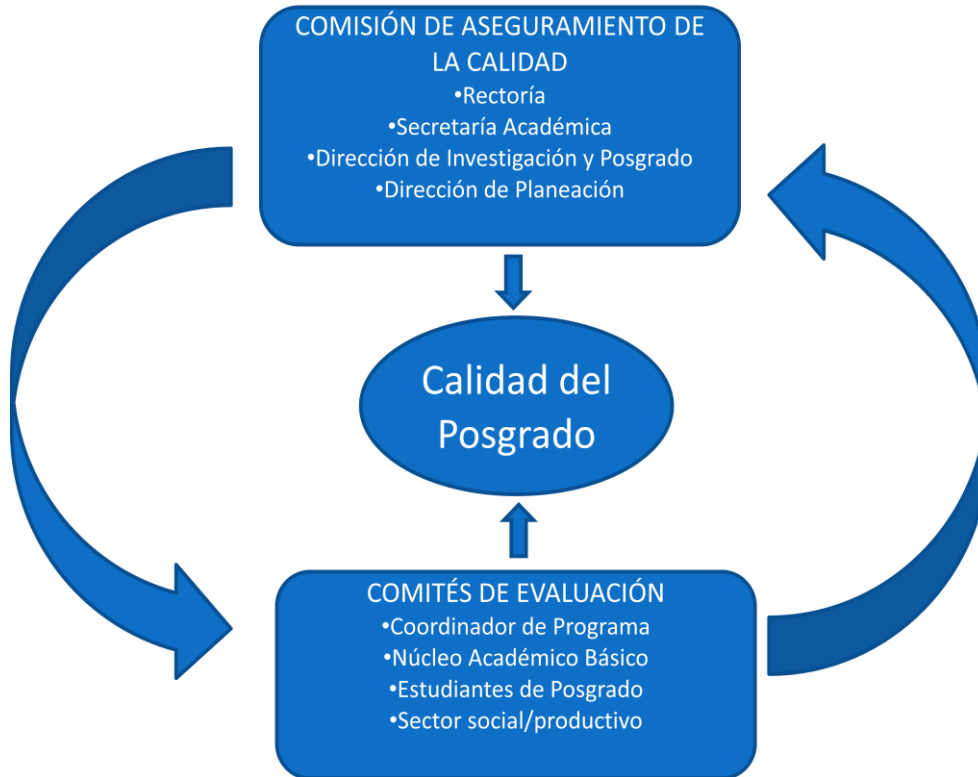
Figura 2. Responsables del funcionamiento del SIAC para el posgrado en la Universidad Politécnica de Sinaloa.